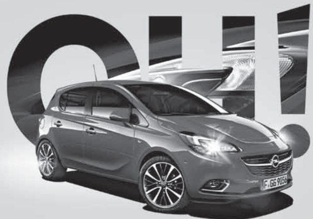
Abb. zeigt Sonderausstattungen.