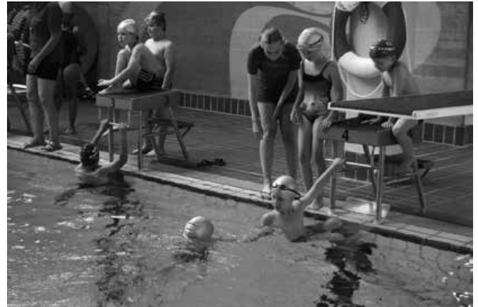
Wechsel bei der Staffel

Ein herzliches Dankeschön geht an alle Aktiven, Übungsleiter, Helfer, Eltern und Zuschauer. HH