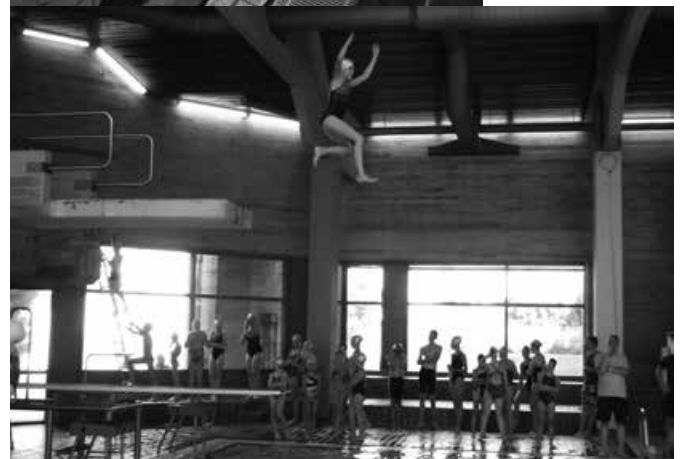
Wer's nicht gesehen hat, glaubt's nicht: „schweben“ 3 m hoch über dem Wasserspiegel