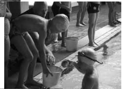
kein Tropfen daneben – alles zählt