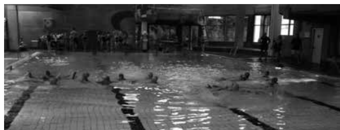
Ketten-Schwimmen mit Schwimnudeln