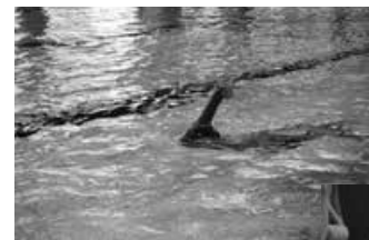
Nichts verschütten: Wasser ist kostbar