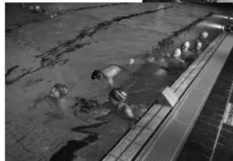
Wie soll ich denn schwimmen, wenn der mich festhält? Da brauch'ste viel Puste!