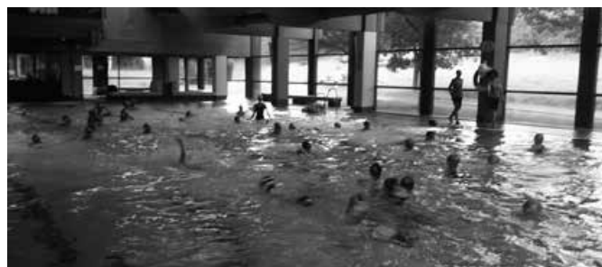
Kommando „Feuer“ - Alle untertauchen!