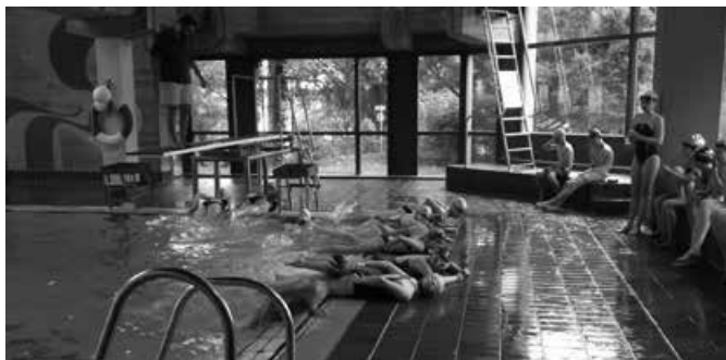
Kommando „Sturm“ - Alle aus dem Wasser!