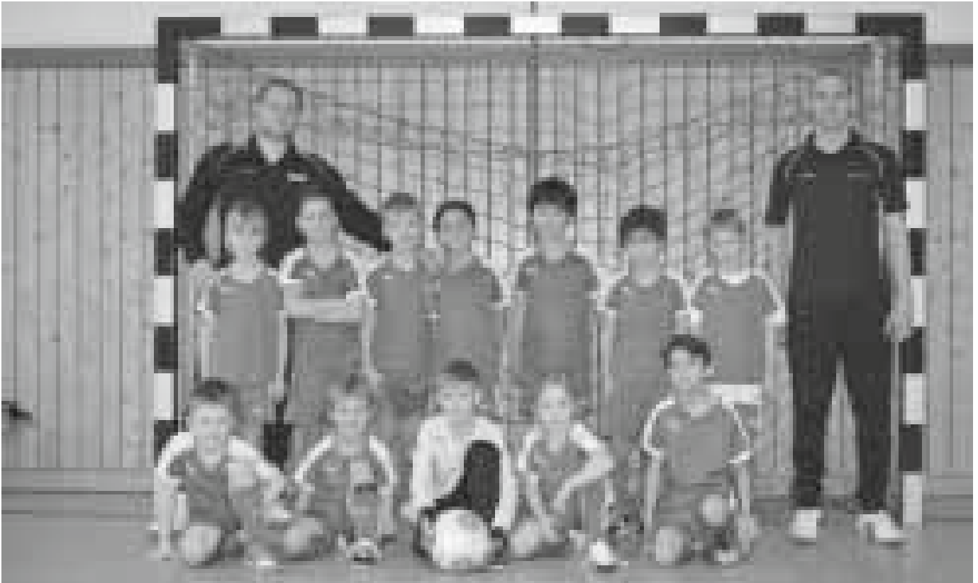
Mannschaftsfoto Hallencup 2016