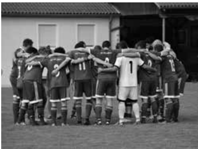
Der Moment der Erleichterung. In Hohlach macht der TSV frühzeitig den Klassenerhalt sicher.