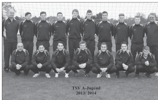
TSV A-Jugend 2013/2014