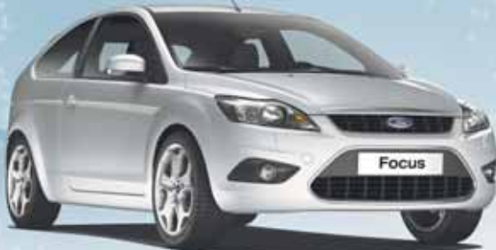
Abbildung zeigt Wunschausstattung gegen Mehrpreis.

Heißer Schlitten in kalten Jahreszeiten.