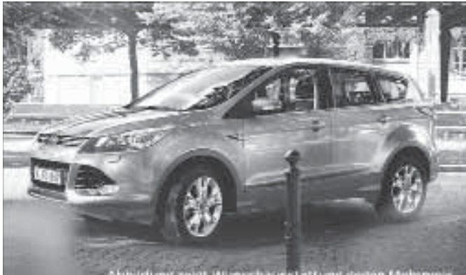
Abbildung zeigt Wunschausstattung gegen Mehrpreis.