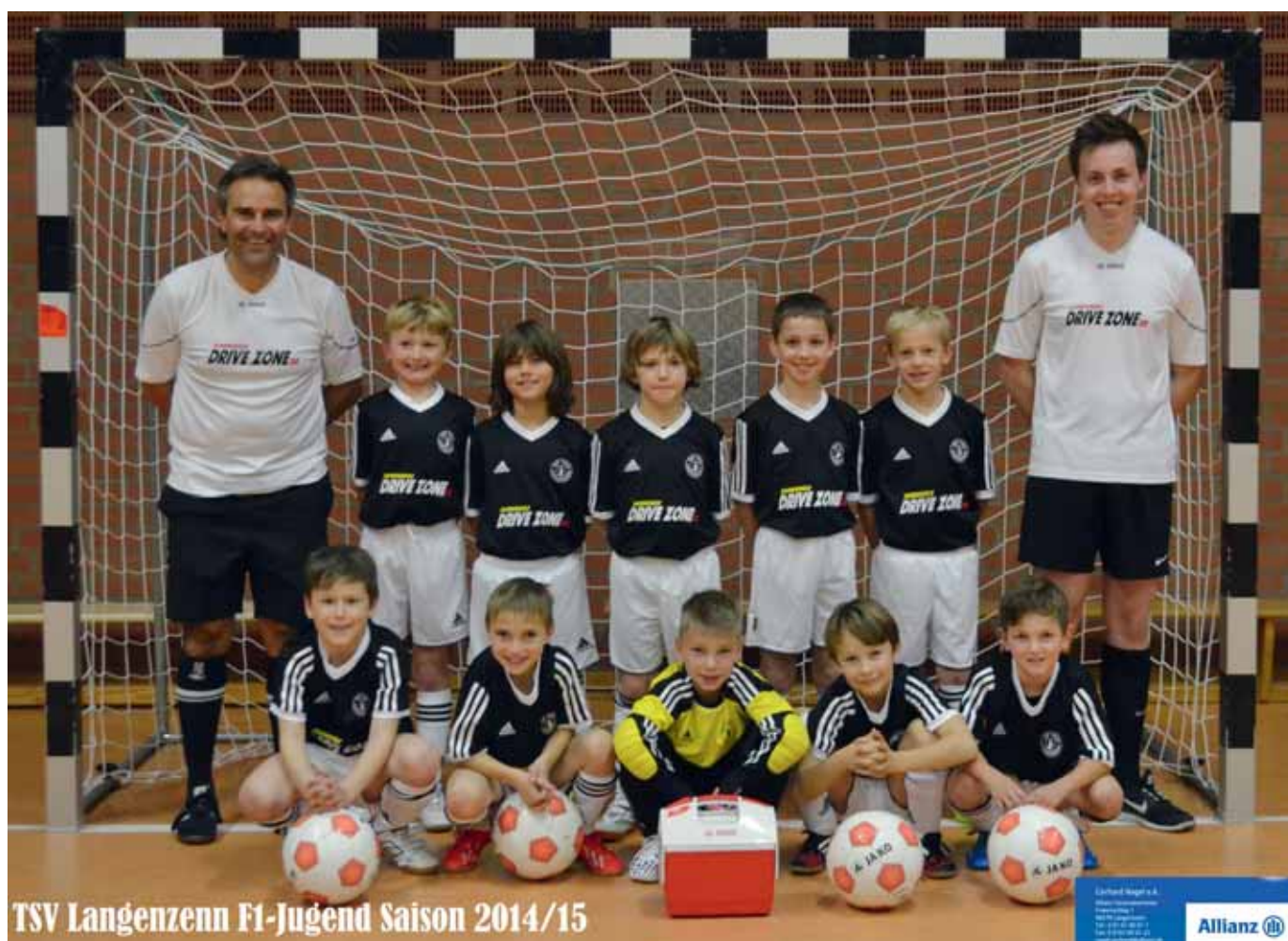
TSV Langenzenn F1-Jugend Saison 2014/15

Der TSV Langenzenn im Internet unter: www.tsv-langenzenn.de